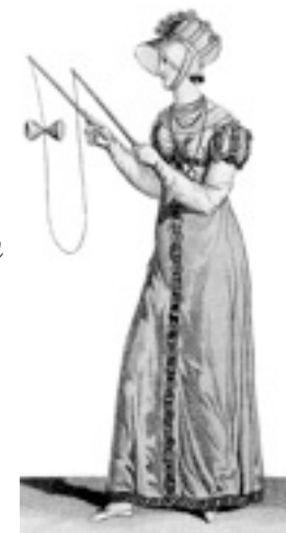
een prent uit 1812

Het belangrijkste bij diabolóën is snelheid. Als de diaboló niet draait, valt hij van het touw af.