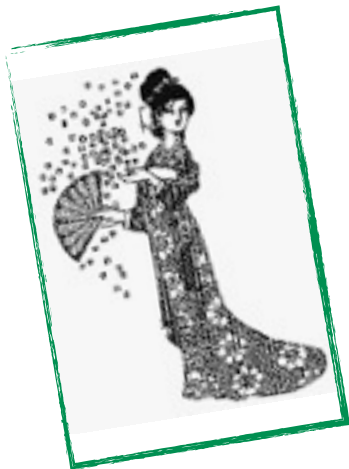
de Chinese sneeuwstorm