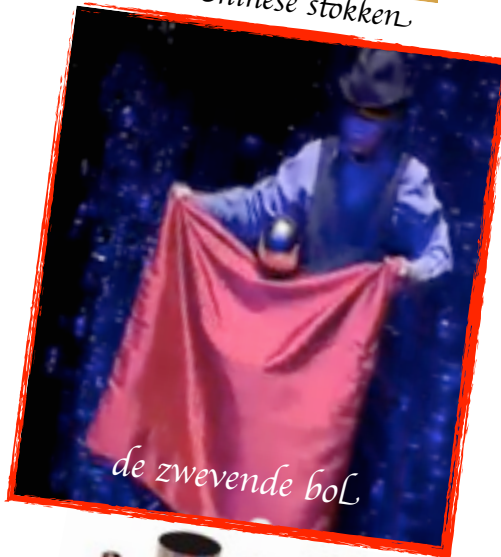
de zwevende bol