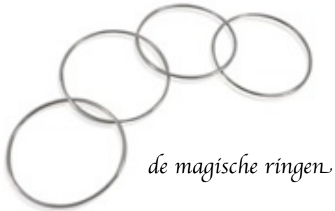
de magische ringen