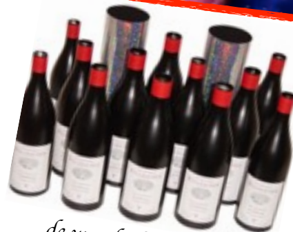
de wonderlijke flessen