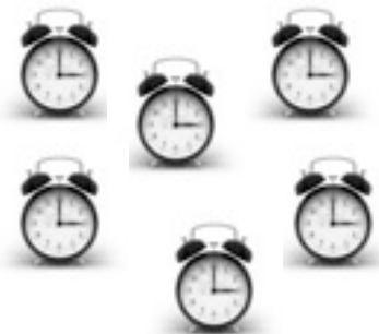
de magische wekkers