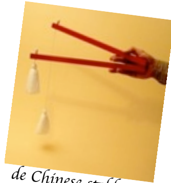
de Chinese stokken